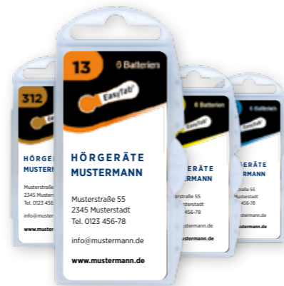
Activair EasyTab Private Label (schwarz)