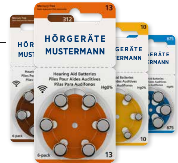
Rayovac Private Label

Größen: 10, 13, 312 und 675 Blistergröße: 6 Zellen Mindestabnahmemenge je Größe: 60 Zellen Staffelpreis: auf Anfrage • Individualisierung: Logoeindruck farbig • Mindestabnahmemenge je Bestellung: 600 Zellen