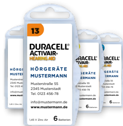
Activair EasyTab Private Label (weiß)