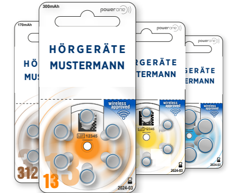
power one Mini Private Label (weiß)