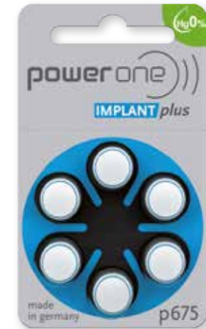
power one IMPLANT plus