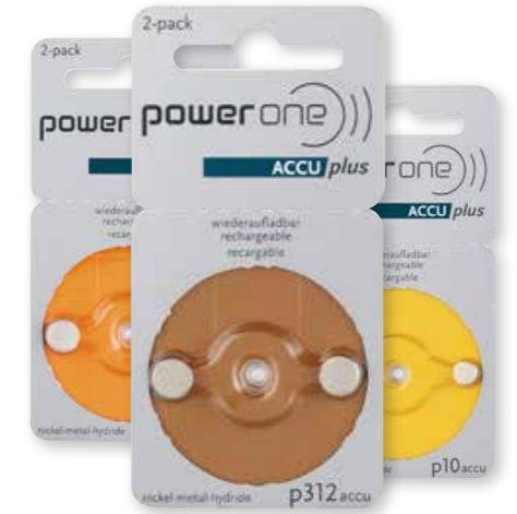
power one ACCU plus