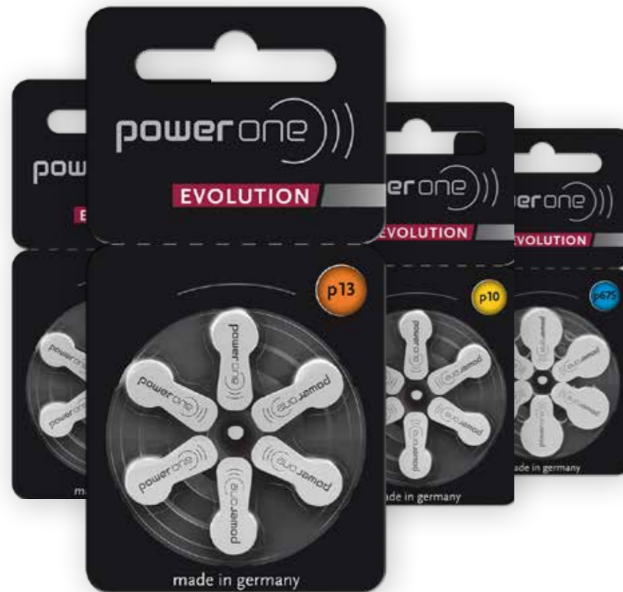
power one Evolution