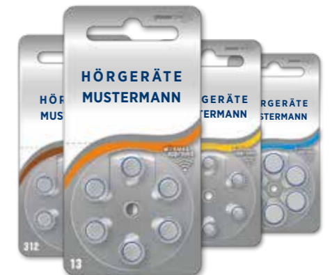
power one Mini Private Label (silber)