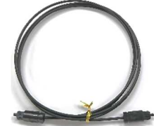
光デジタルケーブル 1.5m