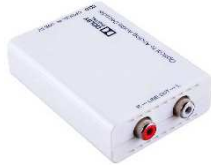
TV-DEX用オーディオ変換器 (DCT-1D)