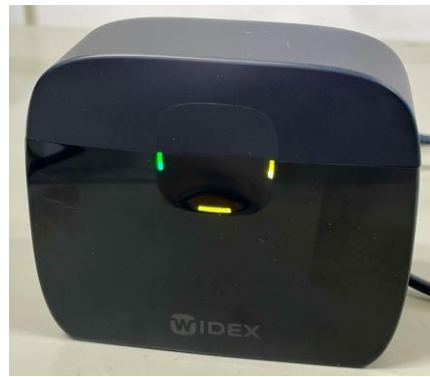
片方だけ黄色で点滅