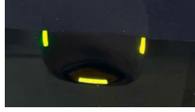
補聴器をセットした後黄点灯