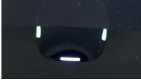
充電器を電源につなぐと白点滅