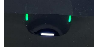
充電・乾燥開始（緑・白点滅）