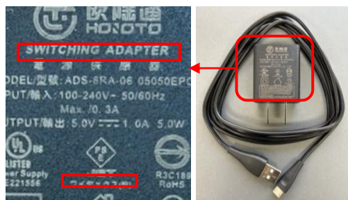
ワイデックス純正電源アダプターと マイクロUSBケーブル