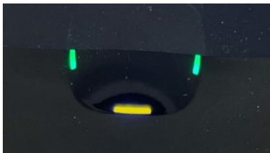
フタを開けると黄点灯（乾燥中断）