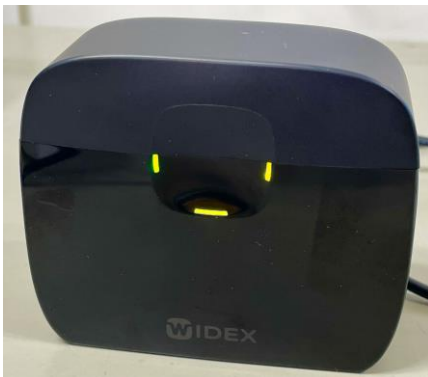
充電中に黄色で点滅