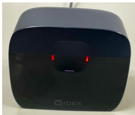
片方もしくは両方が赤で点滅