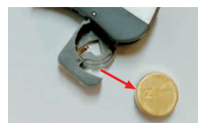
電池は外して保管