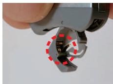
バッテリードア内部接点

汗や水分が付着したまま充電器にセットすると充電電池が劣化し正常に作動しない恐れがあります。補聴器と充電器の接点をブラシや綿棒、乾いた布などで拭いてください。