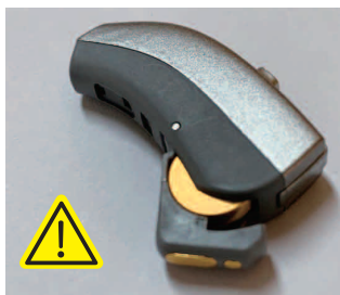
この状態でも通電しています