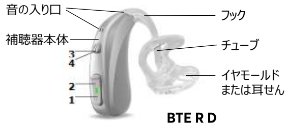
BTE R D