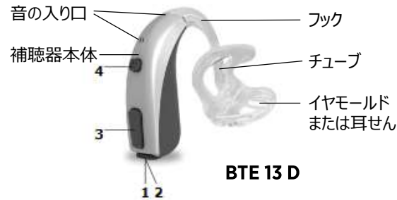
BTE 13 D